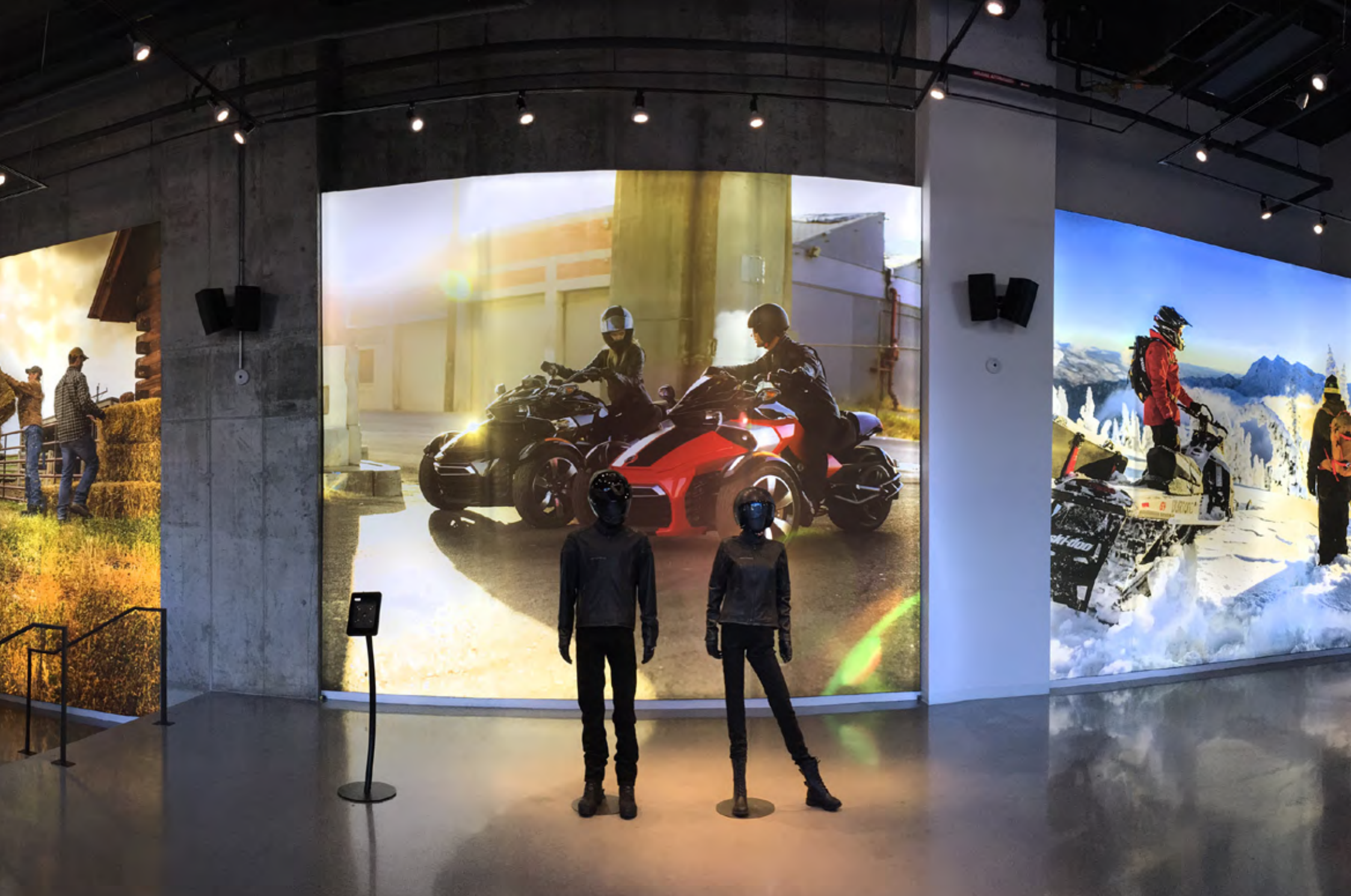
cadres tissu - caissons lumineux